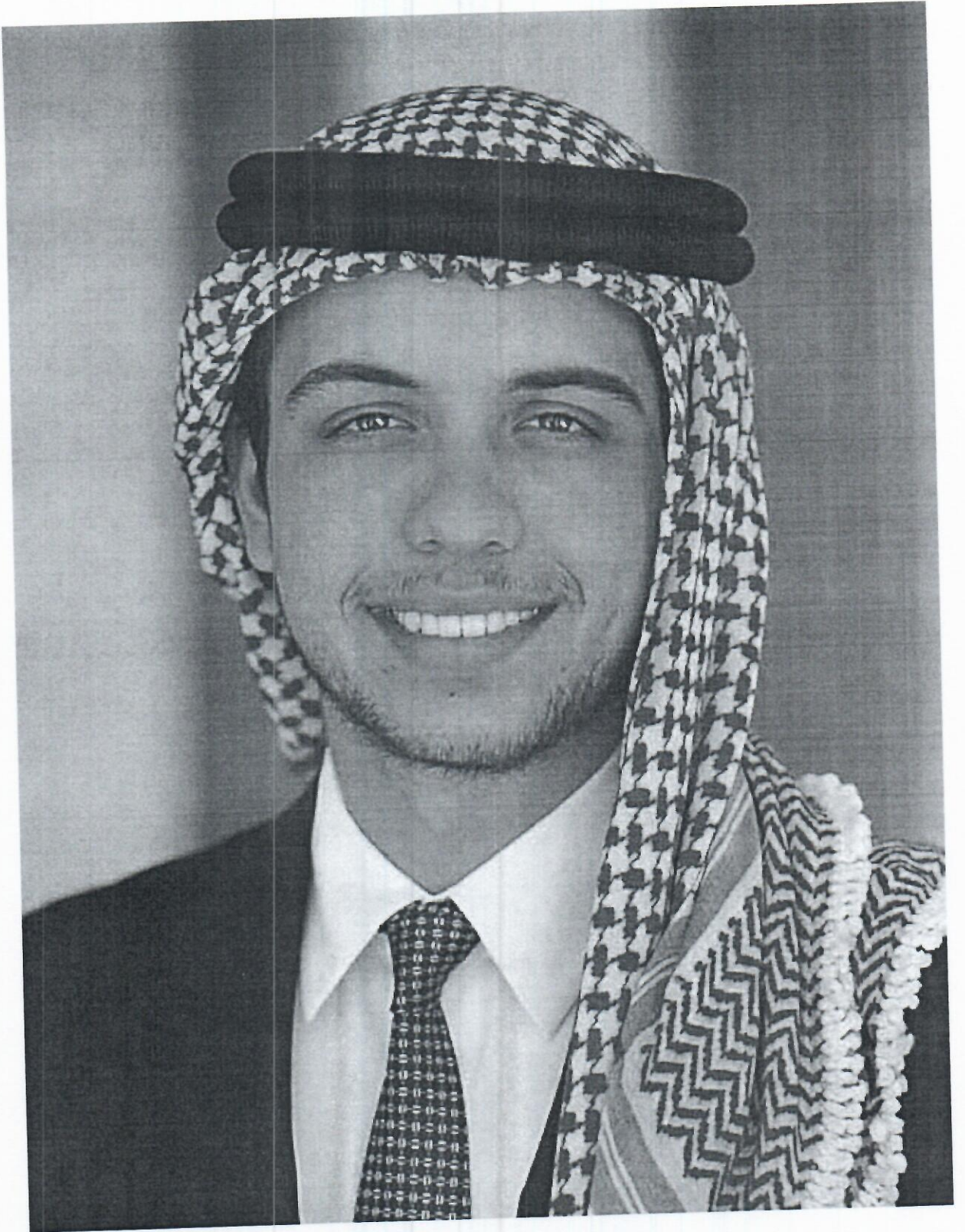
حضرة صاحب السمو الملكي الأمير الحسين بن عبدالله الثاني ولي العهد المعظم