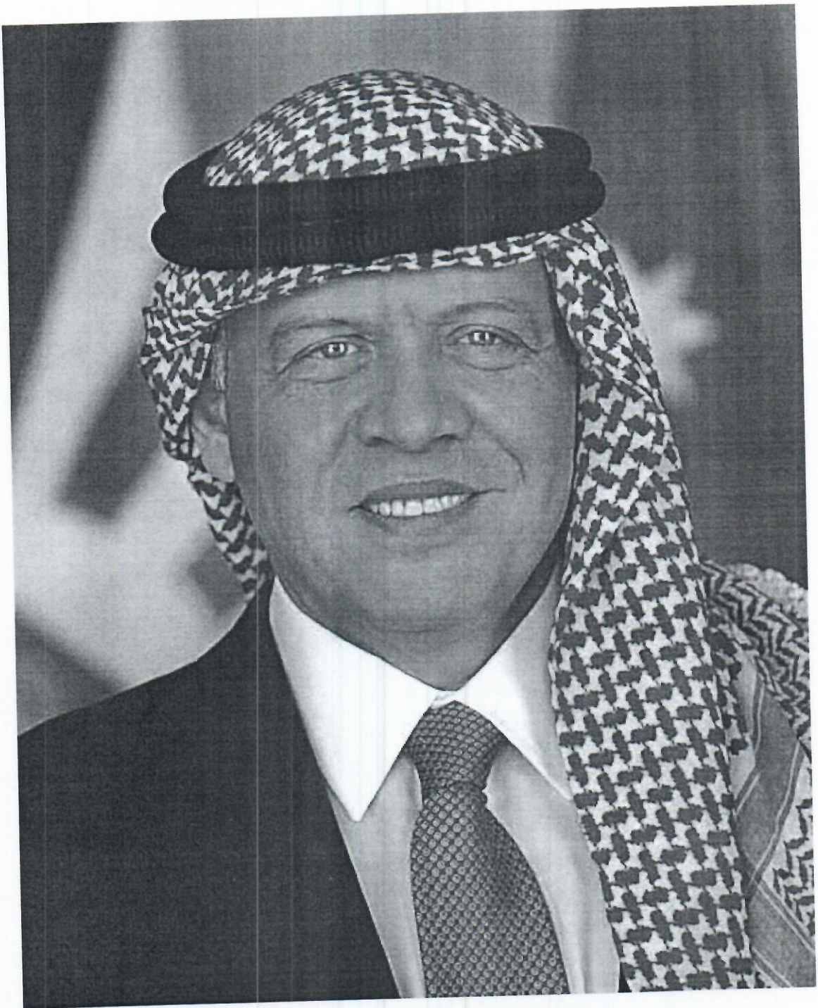
حضرة صاحب الجلالة الهاشمية الملك عبدالله الثاني بن الحسين المعظم