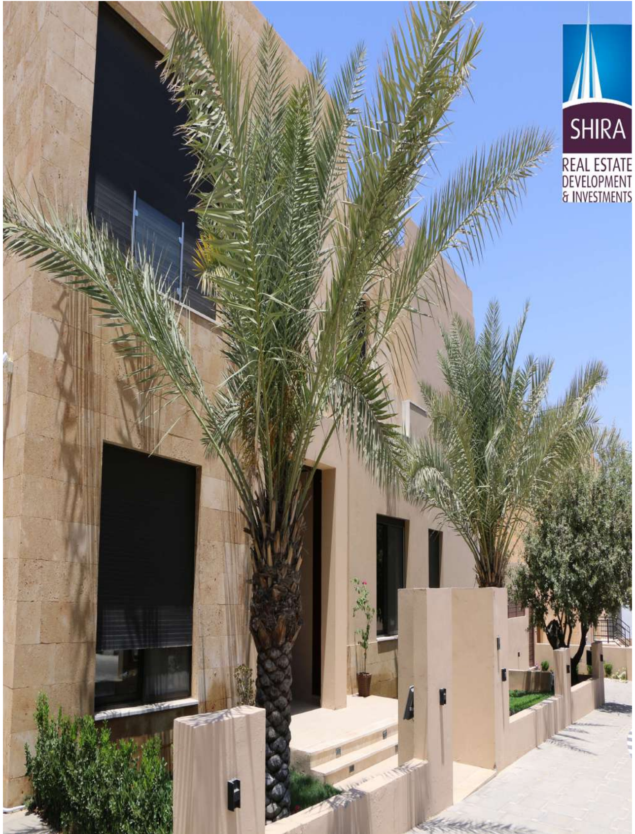
مشروع تلال البلوط – منطقة بدر الجديدة