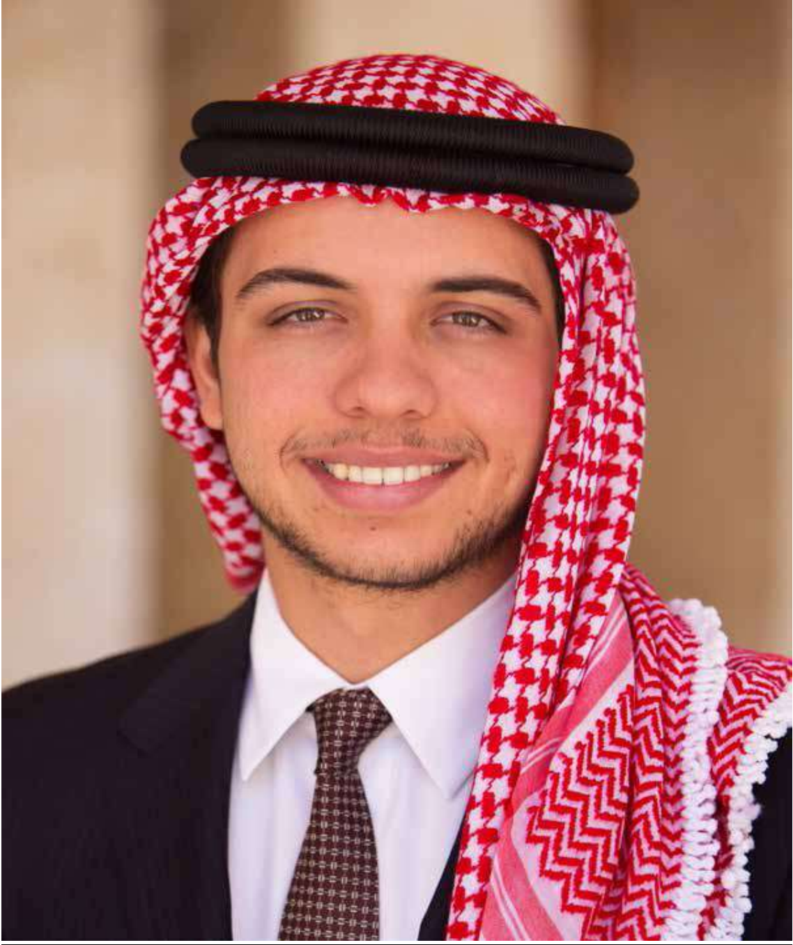
صاحب السمو الملكي ولي العهد الامير الحسين بن عبدالله الثاني