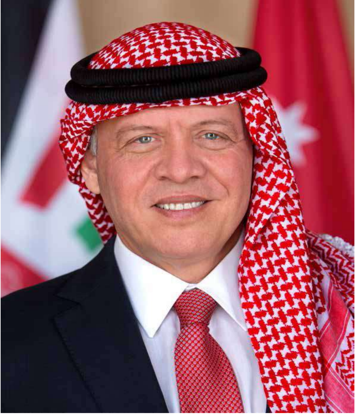
صاحب الجلالة الهاشمية الملك عبدالله الثاني ابن الحسين المعظم