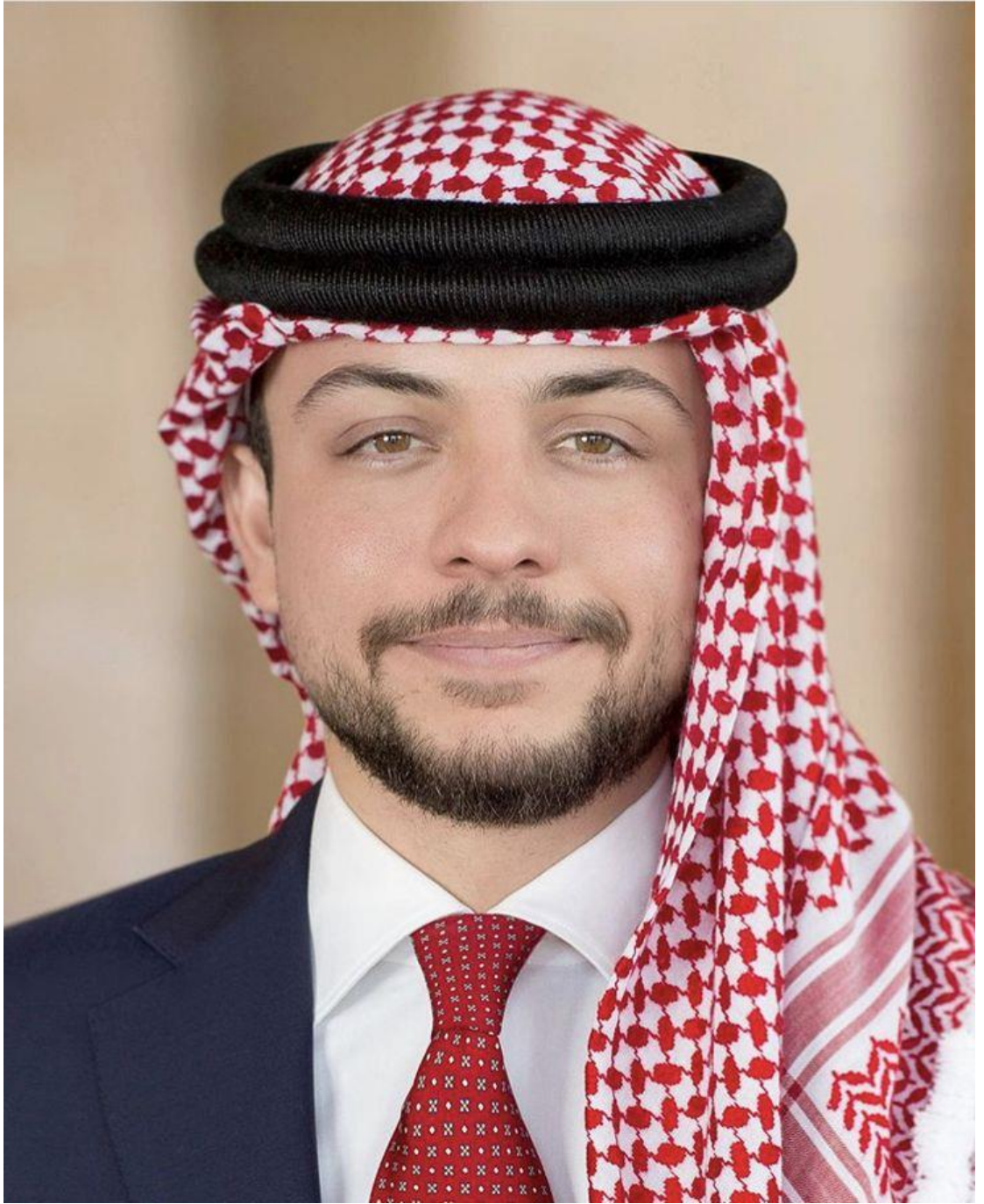
حضرة صاحب السمو الملكي ولي العهد الأمير الحسين بن عبد الله الثاني المعظم