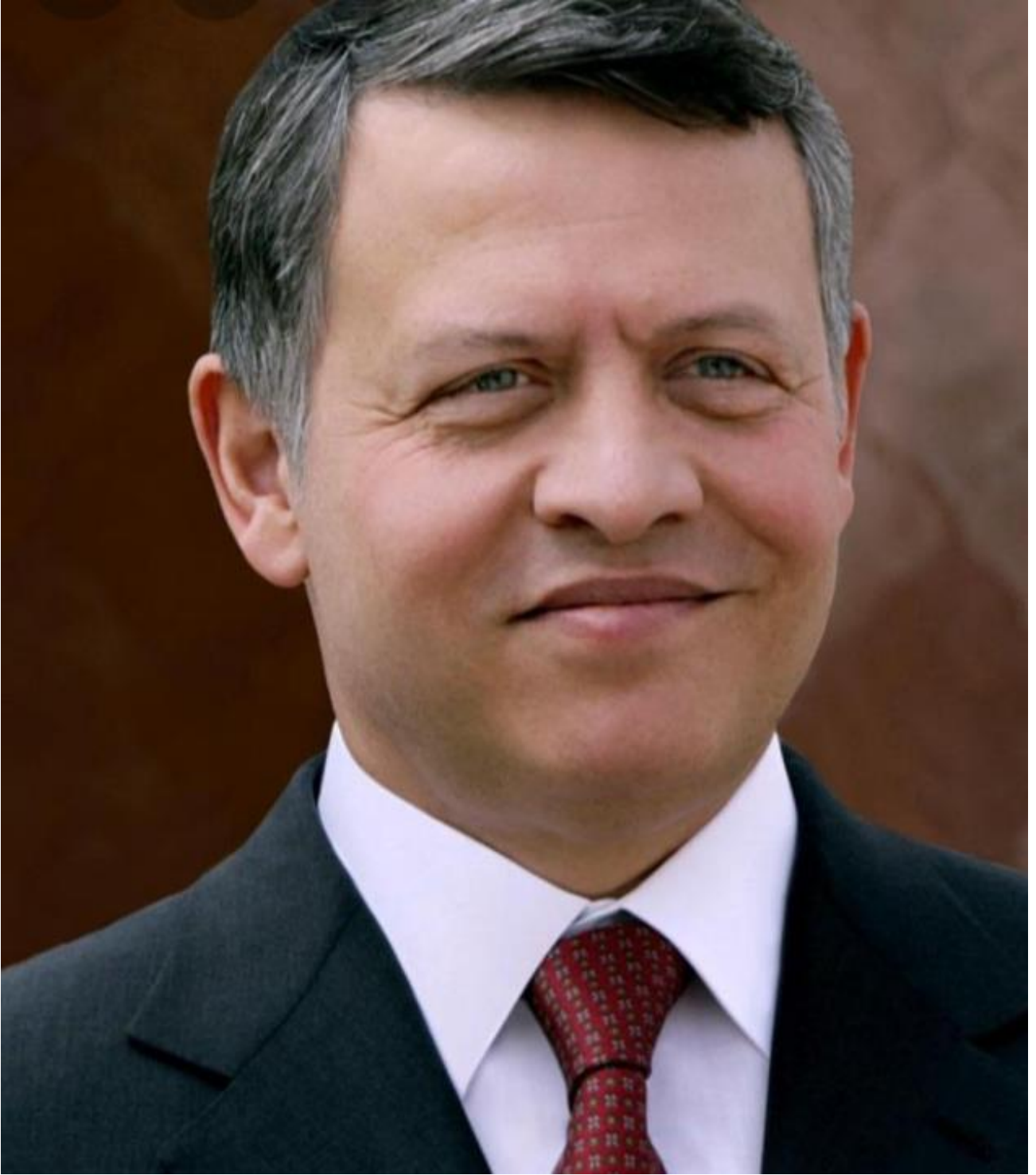
حضرة صاحب الجلالة الهاشمية الملك عبد الله الثاني بن الحسين المعظم