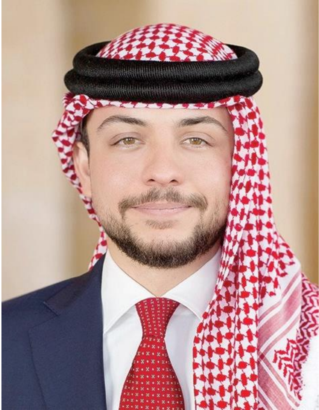
حضرة صاحب السمو الملكي الأمير الحسين بن عبد الله الثاني ولي العهد المعظم