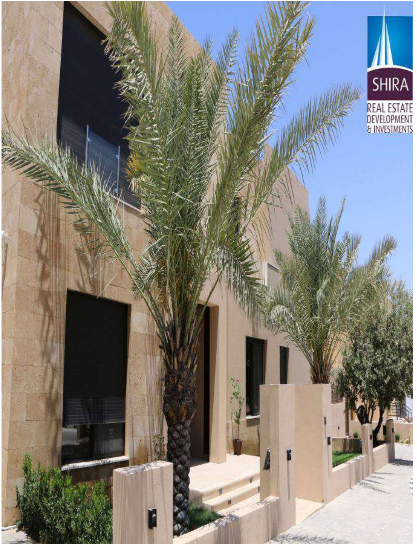
مشروع تلال البلوط – منطقة بدر الجديدة