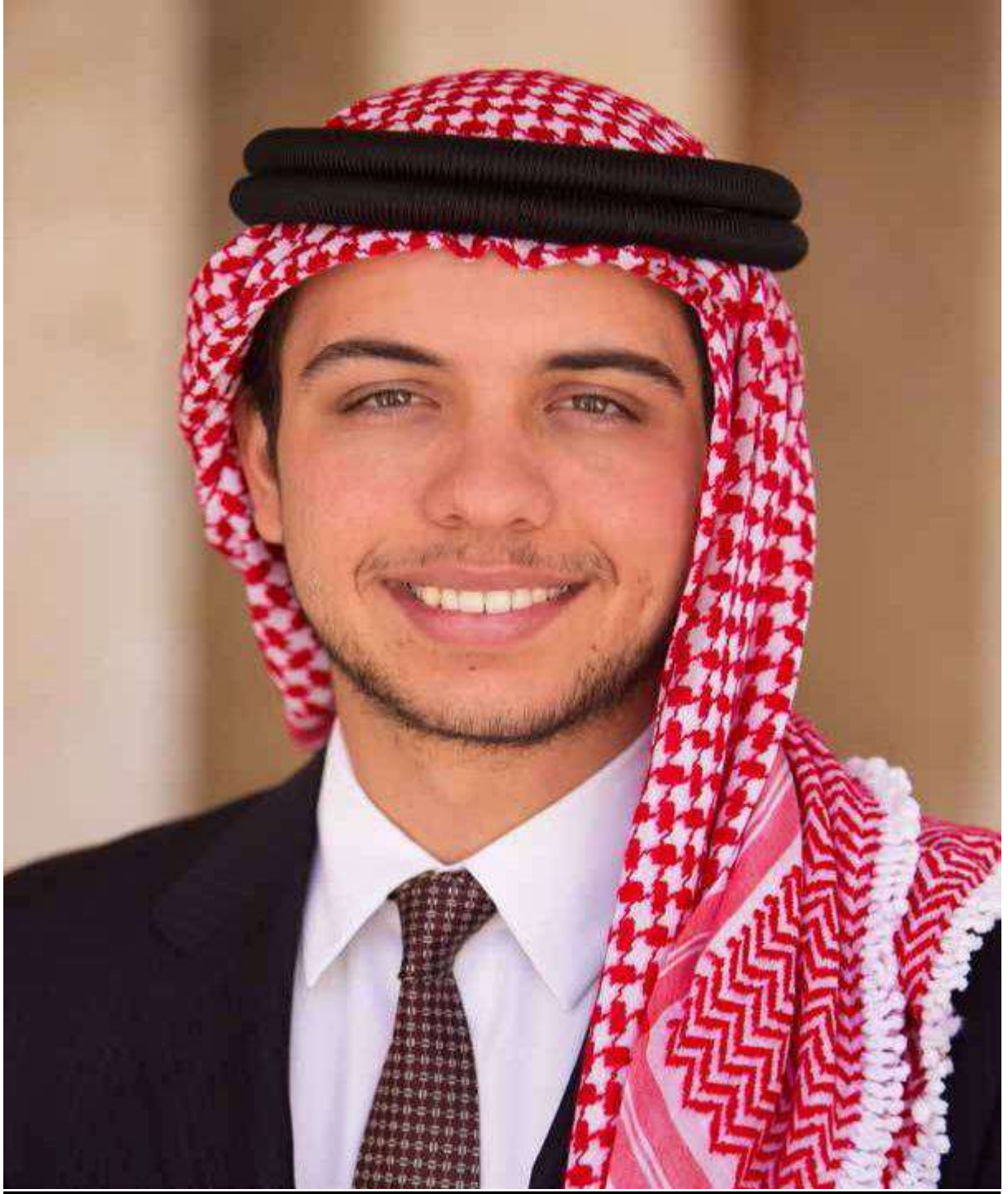
صاحب السمو الملكي ولي العهد الامير الحسين بن عبدالله الثاني