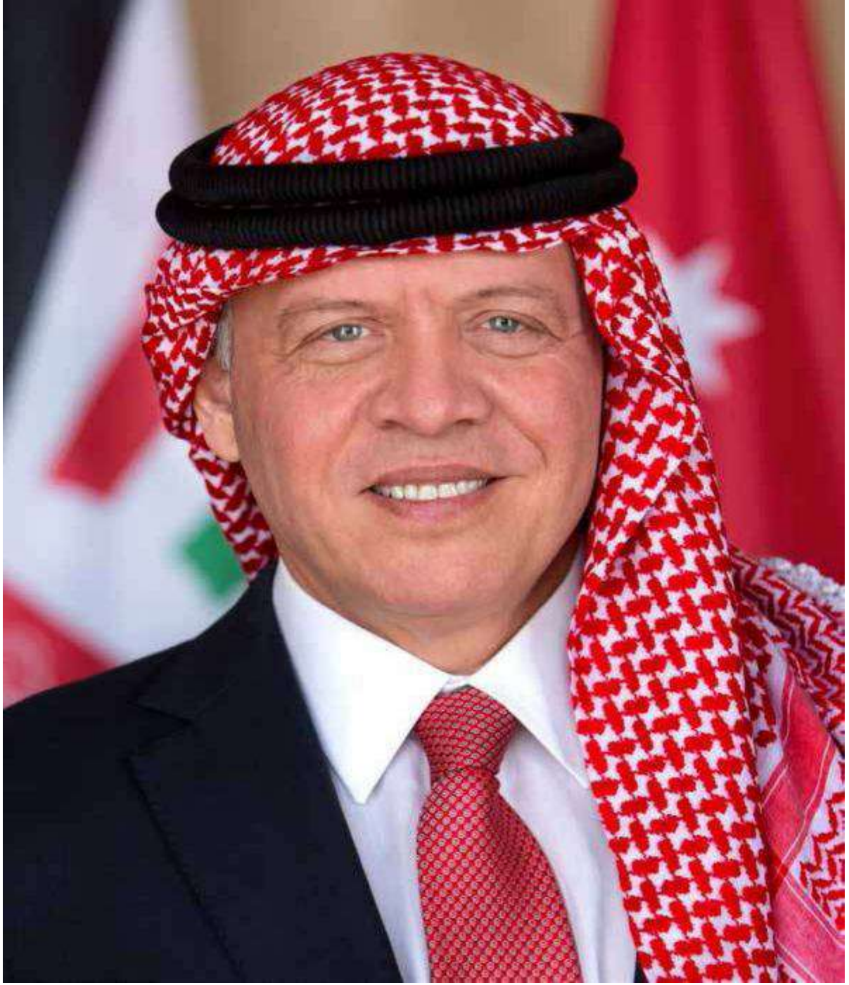
صاحب الجلالة الهاشمية الملك عبدالله الثاني ابن الحسين المعظم