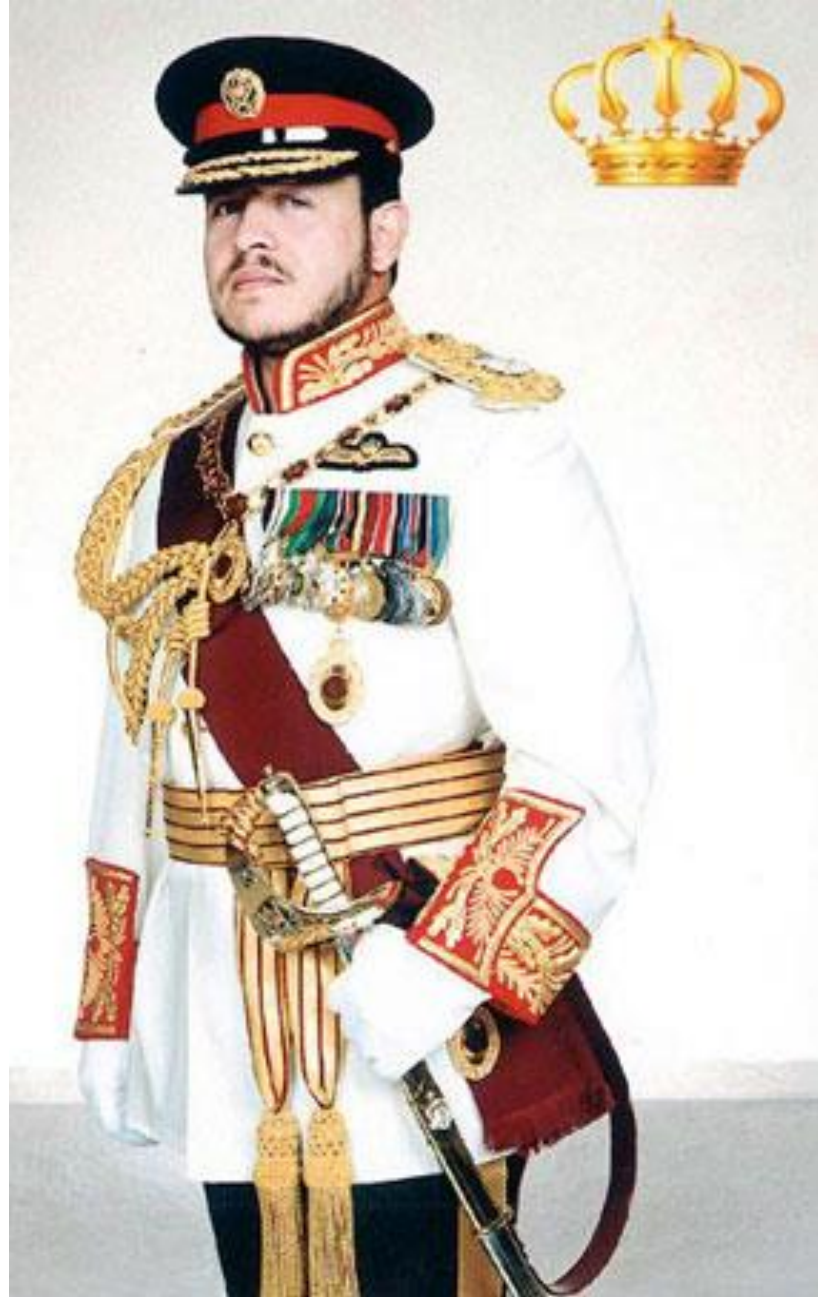
حضرة صاحب الجلالة الملك عبدالله الثاني ابن الحسين المعظم