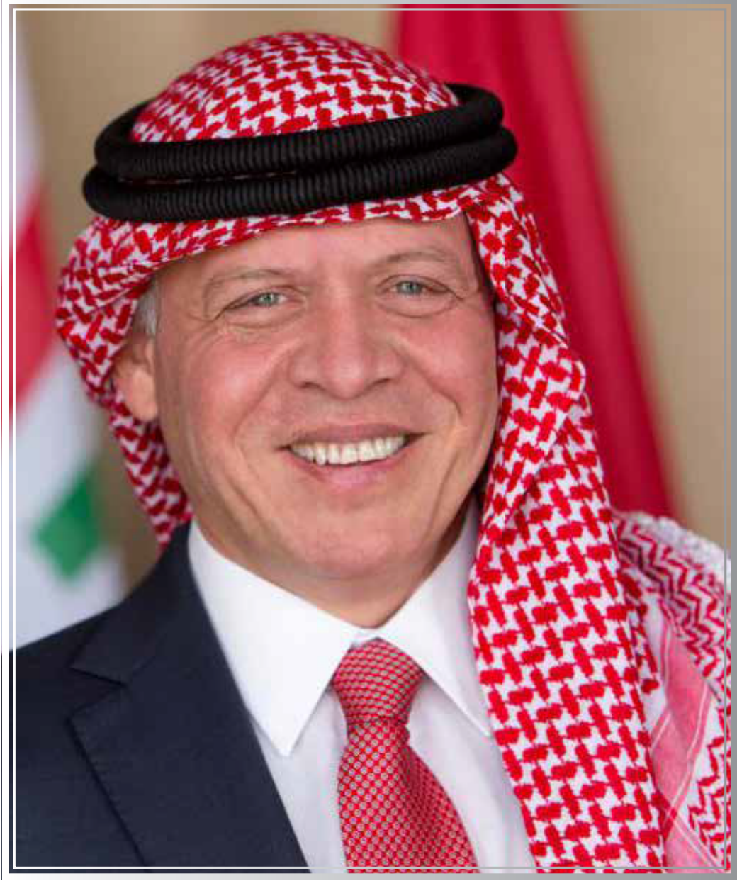
حضرة صاحب الجلالة الملك عبدالله الثاني ابن الحسين المعظم