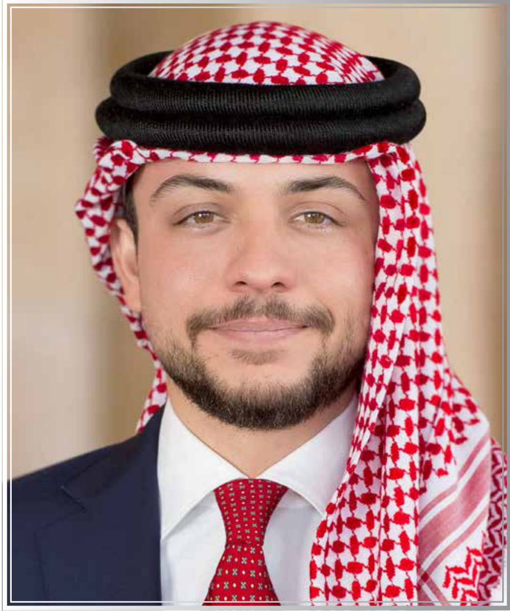
حضرة صاحب السمو الملكي الحسين ابن عبدالله الثاني ولي العهد