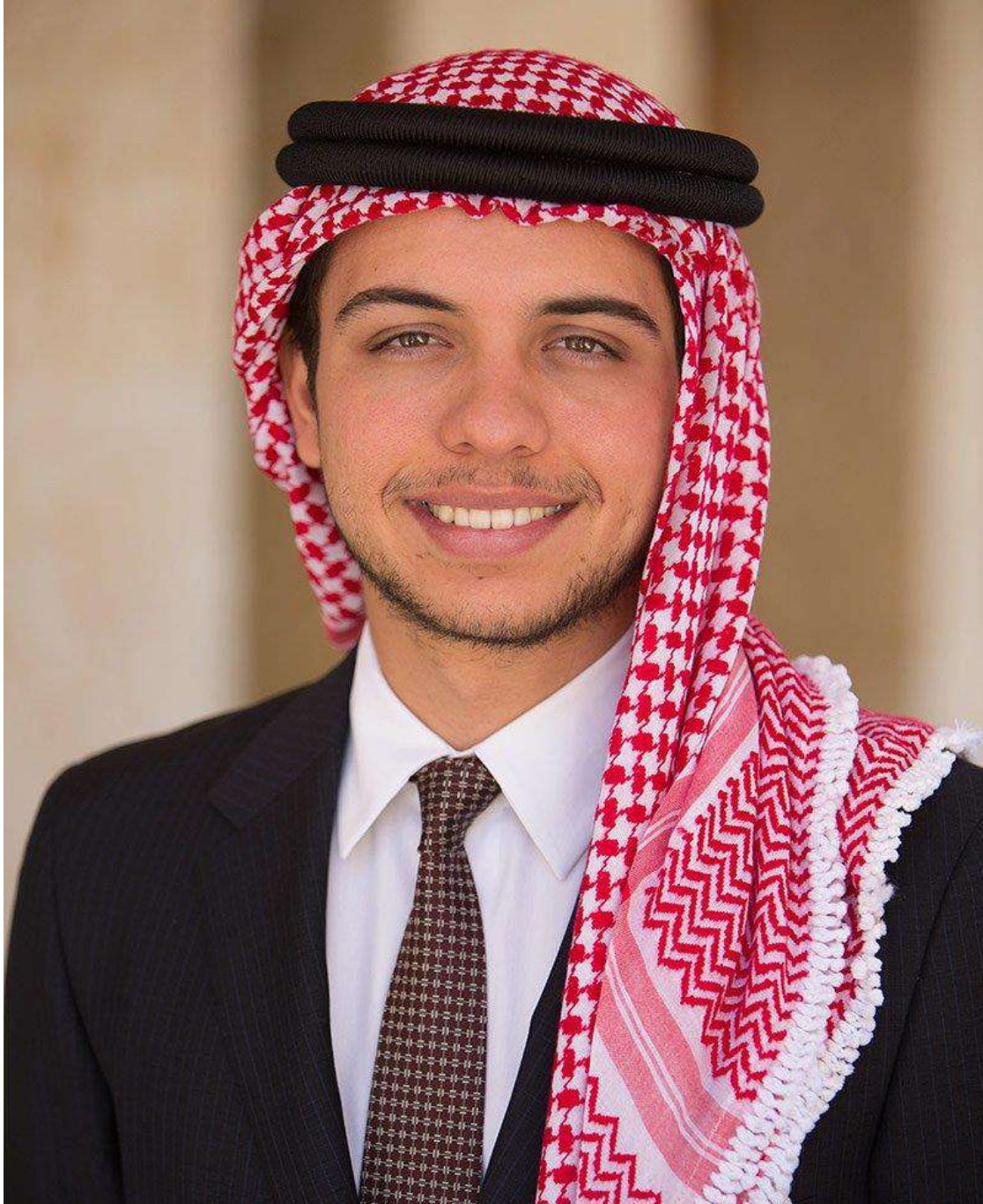
حضرة صاحب السمو الملكي الأمير حسين بن عبد الله وليّ العهد حفظه الله ورعاه