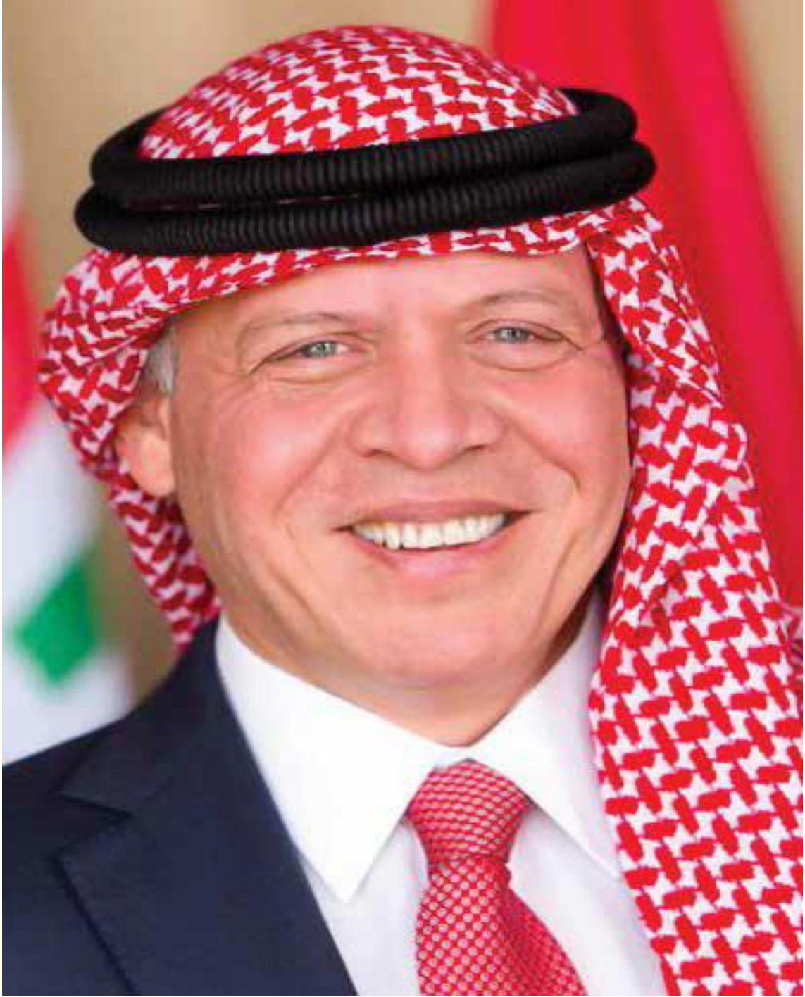
حضرة صاحب الجلالة الملك عبد الله الثاني بن الحسين المعظم (حفظه الله)