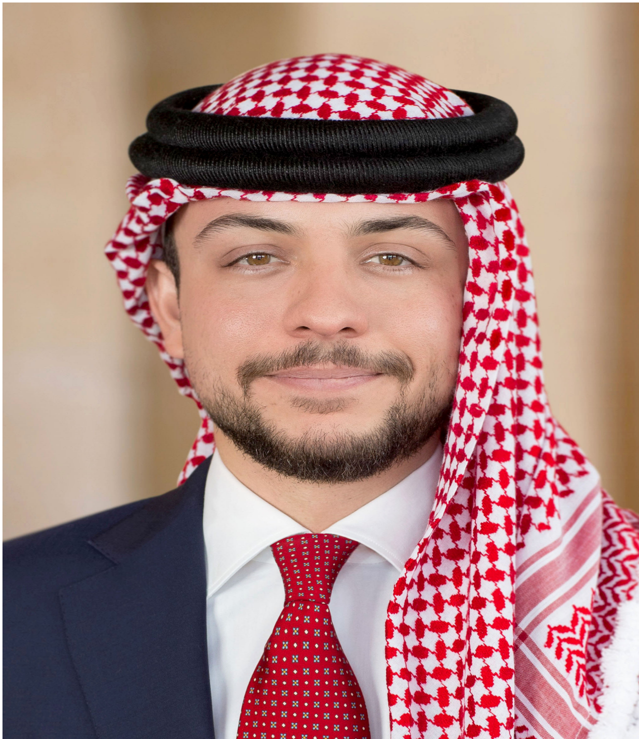
صاحب السمو الملكي ولي العهد الأمير الحسين بن عبدالله الثاني