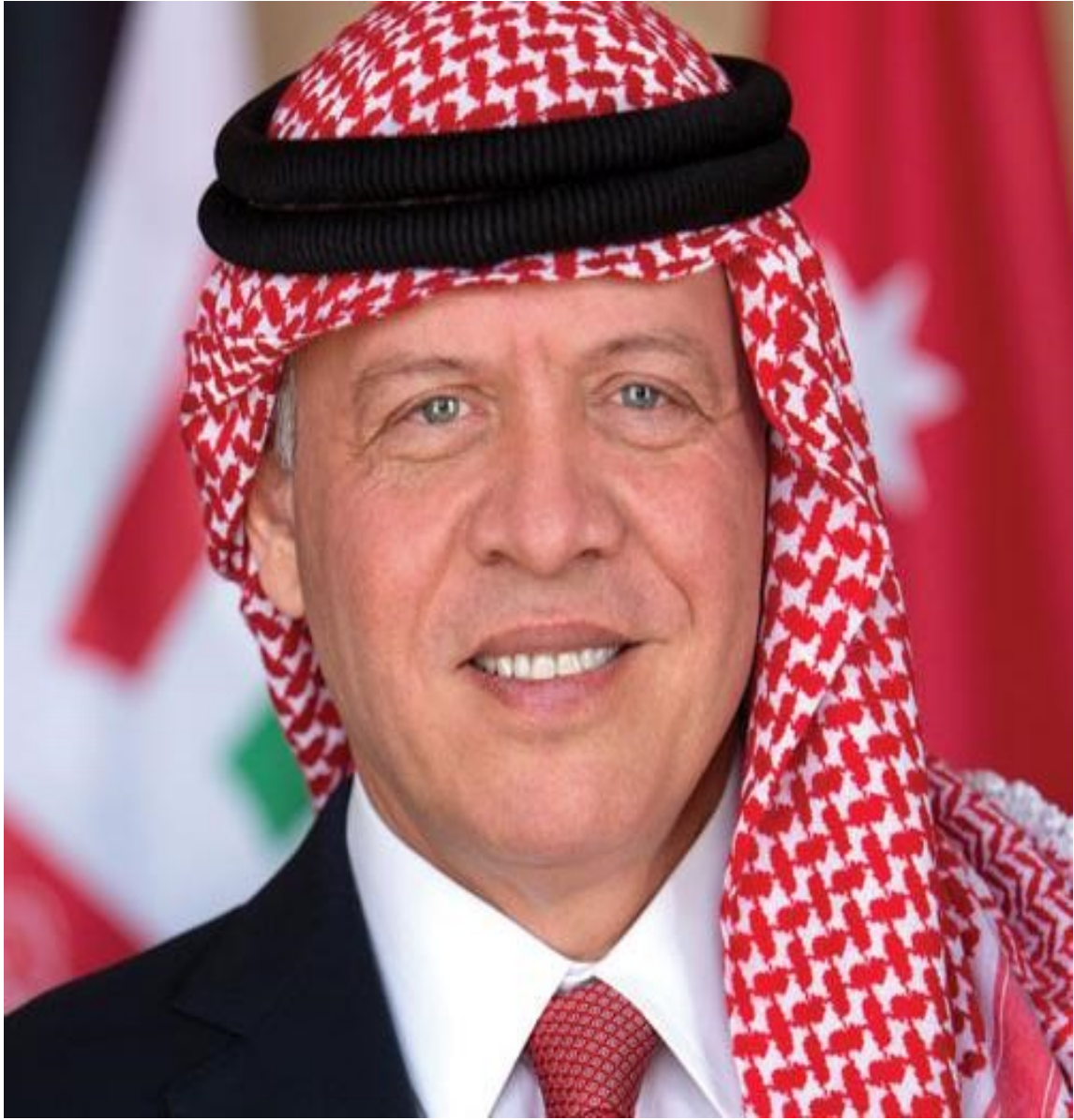
صاحب الجلالة الهاشمية الملك عبدالله الثاني بن الحسين المعظم